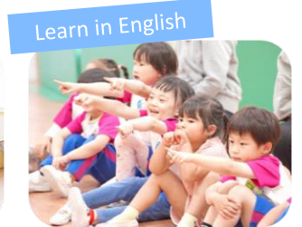
Learn in English